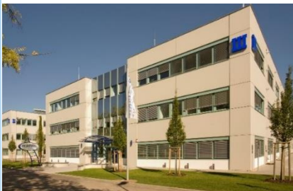
Biopark-Anlage in Regensburg

Buslinie 6 „Haltestelle Otto-Hahn-Straße“ Fahrzeit ab Regensburg Hauptbahnhof 14 Minuten